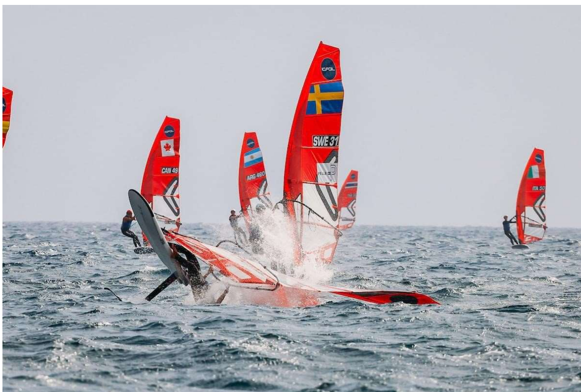
Bilder från Youth and junior World Championships i Sa Rapita, Mallorca