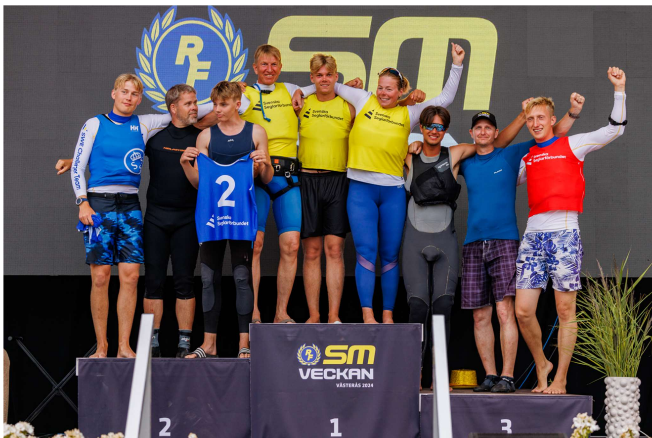
SM Formula Foil 2024 Klass

Sailed: 6, Discards: 1, To count: 5, Entries: 9, Scoring system: Appendix A