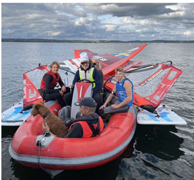
Bilder från OCR på KSSS oktober 2024