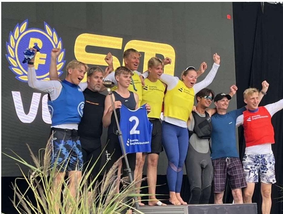
Bild från prispallen SM-veckan i Västerås juni 2024

26–28 juni var det SM-veckan i Västerås som i år bjöd in Iq foil och Formula foil som deltagande klasser. I och med att OS närmade sig var det ett stort fokus på denna klass under SM-veckan vilket också bidrog till att också TV intresserade sig för klassen vilket skapade lite extra glam till tävlingarna. Värdet bjöd på strålande sol och en av de varmaste veckorna under sommaren men också nästan helt vindstilla stunder när tävlingarna var planerade. Detta ledde till uppskjutna race, inställda race och lång väntan på vattnet och land. Trots detta kunde det genomföras både grundomgång course, grundomgångslalom och grundomgång maraton samt final.